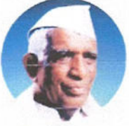
Founder President, Council of Education, Kolhapur